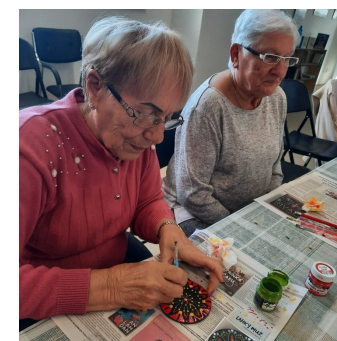
Kézműves foglalkozás szenioroknak