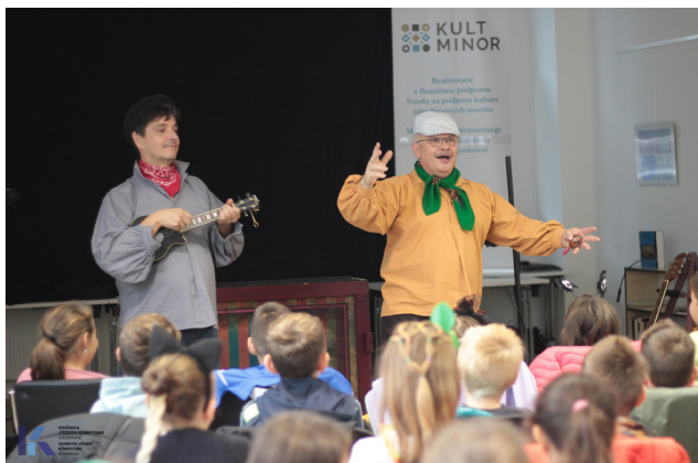
Hüvelyk Matyi: a Meseszínház előadása

Az óvodásoknak és kisiskolásoknak gyermekkönyvtárosaink rendszeresen szerveznek tematikus foglalkozásokat – az olvasás népszerűsítésére vonatkozóan, egy-egy ünnepkörhöz, évszakhoz kapcsolódóan. Több alkalommal hívtuk meg a kortárs gyermekirodalom kiemelkedő alkotóit, bábelőadókat, akik mindannyiszor színvonalas programmal szórakoztatták legfiatalabb olvasóinkat.