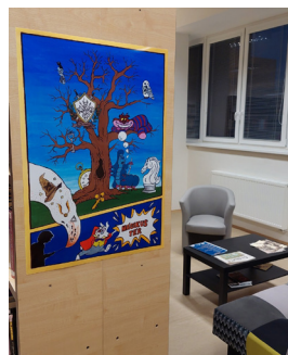
Mágikus tér plakátpályázat

A filmek és a mozi kedvelői körében már törzsközönsége alakult ki filmklubunknak , ahol havi rendszerességgel művészfilmeket, a mozikban nem vetített alkotásokat láthatnak a nézők. Hazai vagy magyarországi filmek esetében a vetítést követően lehetőség szerint beszélgetést szervezünk az alkotókkal, egy-egy szereplővel.