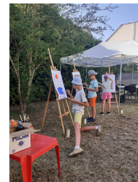
A nyári alkotótábor résztvevői játék, kézműveskedés és olvasás közben

Az idei évben az általános iskolák felső tagozatosainak és a középiskolásoknak is új programlehetőséggel álltunk elő: rendhagyó irodalom- és zeneórákat, ill. játékos könyvtári foglalkozásokat szerveztünk számukra. A hozzánk látogató iskoláknak egy-egy tanítási órát kitöltő, de akár egész napos foglalkozásokat is kínálunk, ami elsősorban a környező települések iskolái számára hasznos, hiszen nekik a könyvtárba való beutazást is meg kell oldaniuk.