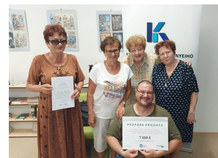
A csoportok résztvevői oklevélben is részesültek

Alkotó kedvű nyugdíjas látogatóink kézműves workshopokon próbálhatták ki kez ügyességüket, szebbnél szebb tárgyakat alkotva.