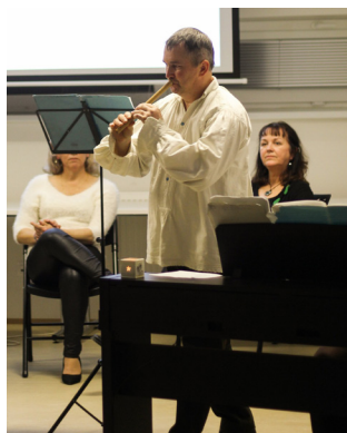
A Hajnalvándor együttes adventi koncertje

Havi rendszerességgel szerveztük meg Zenezalonunkat is, melynek vendégei kiemelkedő zenészek, énekesek, zenetörténészek voltak. Az estek során mindannyiszor zenehallgatásra is sor került, ízelítőt kapva a vendégek által ajánlott zeneművekből.