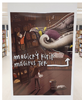
Mágikus tér plakátpályázat