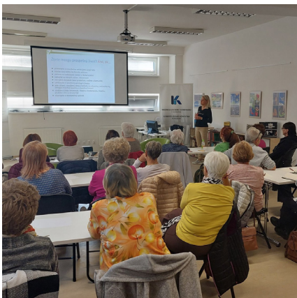
Agytréning foglalkozás szenioroknak

A fizikai és szellemi egészség megőrzését szolgálta a Szenior örömtánc és az Agytréning programsorozatunk. Mindkettő nagy népszerűségnek örvend az idősebb generáció körében, és a későbbiekben is folytatni tervezzük ezeket.