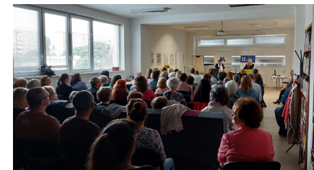
A Hét szépség c. rendezvénysorozat vendége Iveta Radičová szociológussal