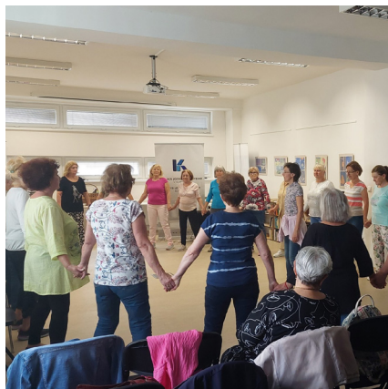
Örömtánc foglalkozás szenioroknak