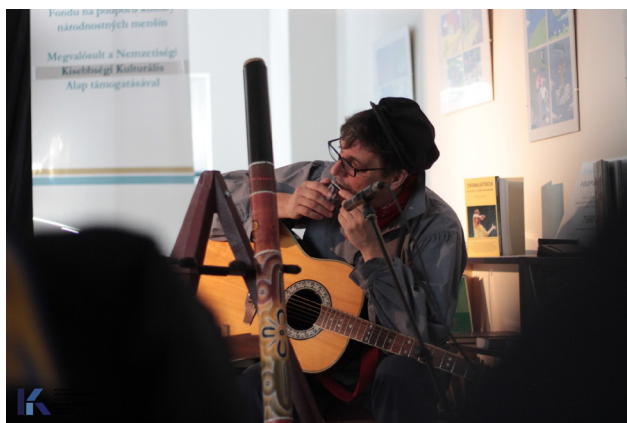
Hüvelyk Matyi: a Meseszínház előadása

Immár nyolcadik alkalommal szerveztük meg nyári alkotótáborunkat gyerekeknek, ahol az olvasás és könyvtári foglalkozások mellett különböző kézműves technikákkal ismerkedhettek meg a résztvevők. A tábor több csoportban, különböző korosztályok számára szerveztük, és már