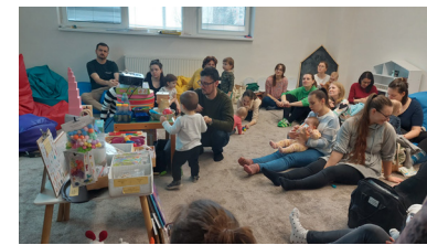
Baba-mama klub foglalkozások a könyvtárban