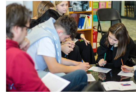
Az iskolás csoportok mindig nagyon élvezik a játékos könyvtári foglalkozásokat

A képregények, mangák és a fantasy irodalom kedvelőit egy elkülönített olvasósarokkal, a „Mágikus tér”-rel leptük meg a szépirodalmi részlegen, ahol egy helyen megtalálhatják az őket érdeklő irodalmat, amit az ott kialakított olvasósarokban akár helyben is lapozgathatnak. Hogy a sarok még hangulatosabb, csalogatóbb legyen, a polcok, falak díszítésére egy