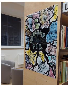
Mágikus tér plakátpályázat

plakátpályázatot hirdettünk alkotókedvű olvasóink számára – és immár az ő műveik díszítik a „Mágikus tér” falait.