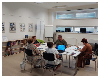
Zajlik az oktatás a Digiszeniorok tanfolyamon

a számítógép-kezelés és internethasználat alapjaival.